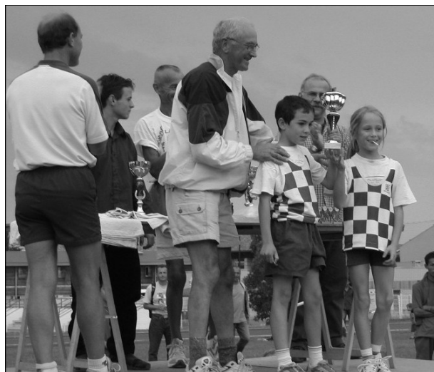
Le podium de l'école d'athlé

Tout se finira par les traditionnels relais 4x60m ou l'équipe de poussins terminera 2ème derrière celle du BEC.