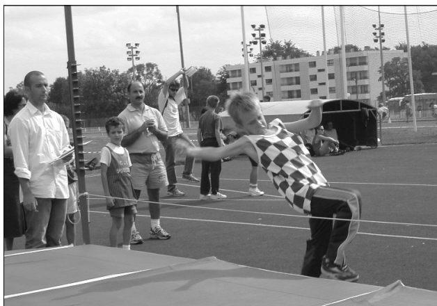
Clément à la hauteur