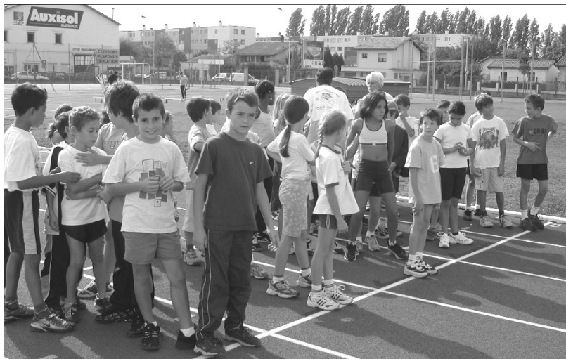
Préparation pour les éducatifs