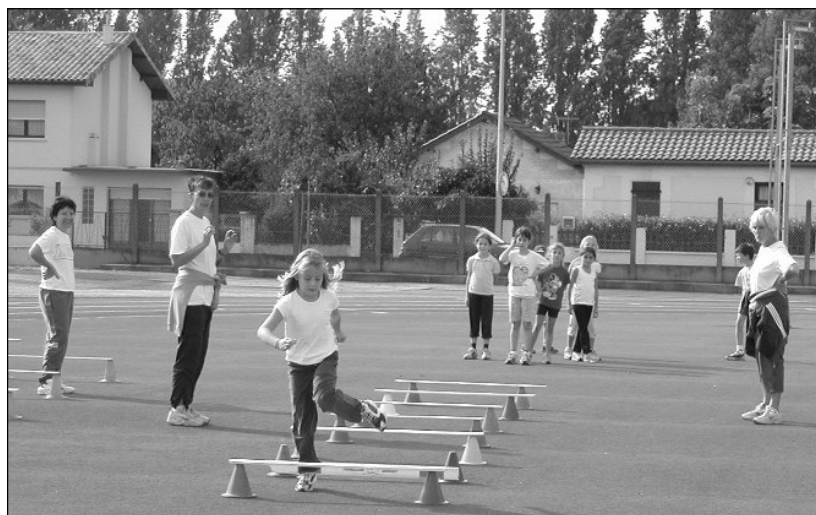
Atelier avec franchissement des lattes sur plots