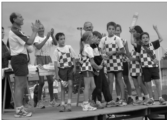
Le podium des vainqueurs du CAB