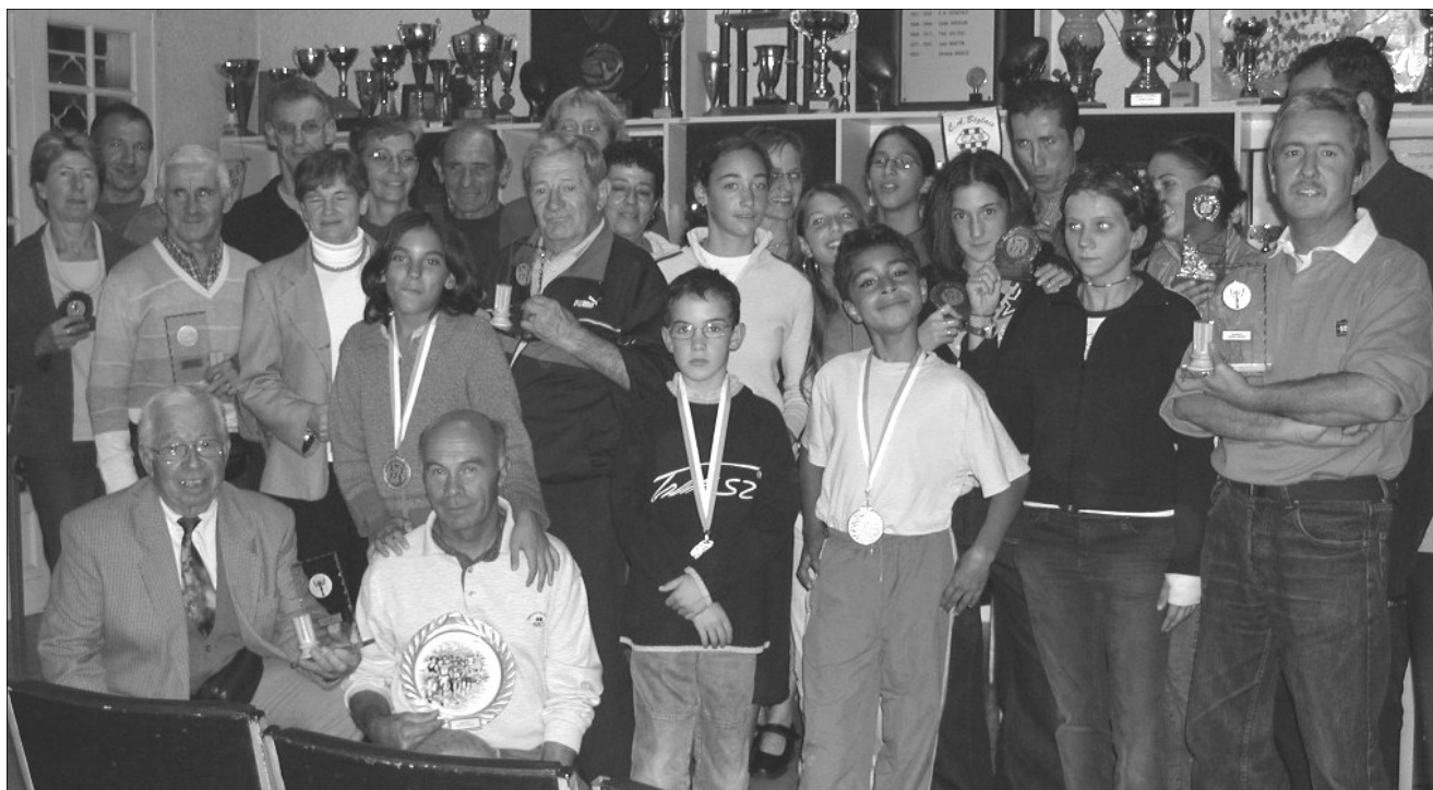
Le groupe des récompensés de la section