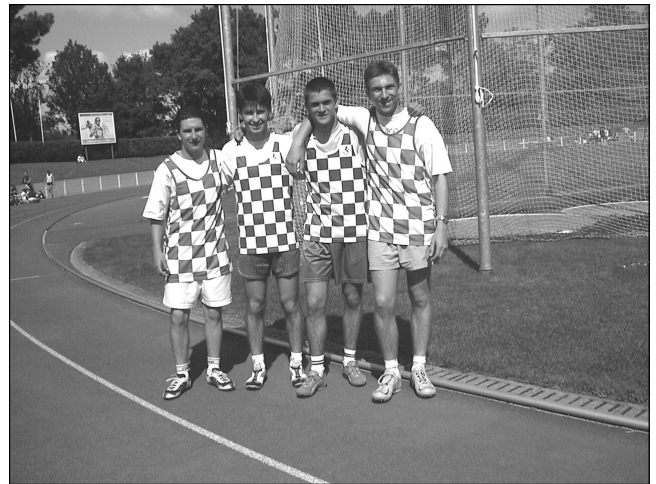
L'équipe de juniors