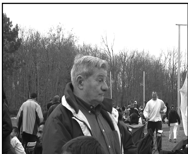
Jean à Portets