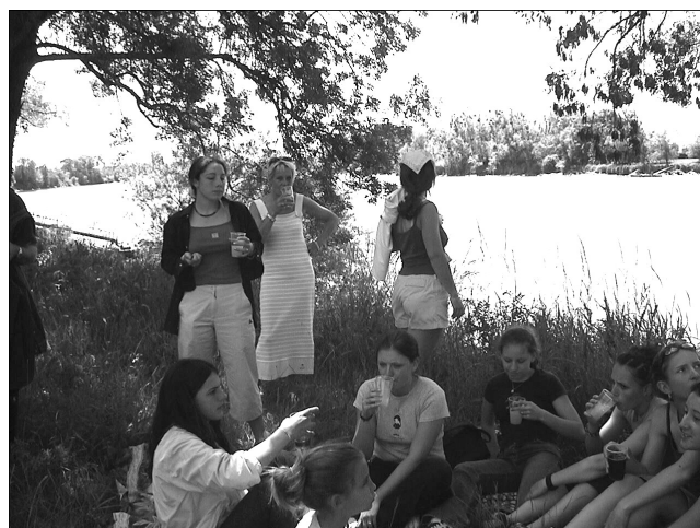
La pause sur les bords de la dordogne