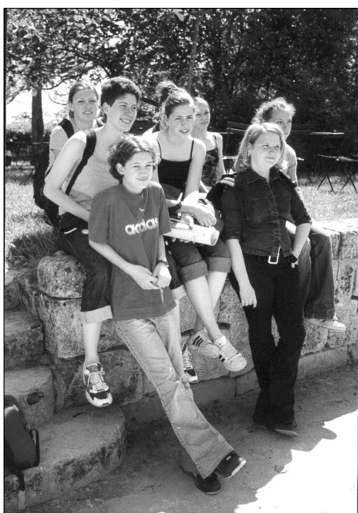
Les correspondantes Allemandes