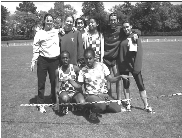
Les cadettes à Talence