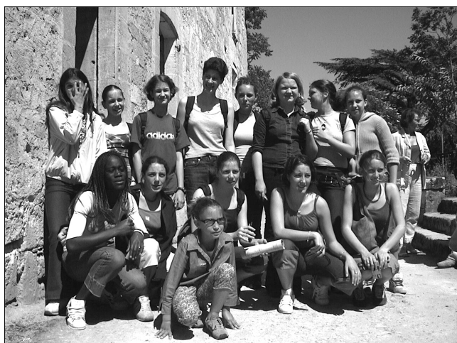
Le groupe à St Emilion