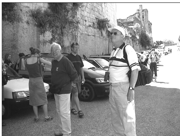
Arrivée à St Emilion

Du jeudi 16 mai au lundi 20 mai les correspondants allemands venaient passer ces quelques jours à Bègles dans le cadre du jumelage. Hébergés dans les familles ils pouvaient profiter de notre vie courante dans leurs moments de liberté. Pris en charge la journée par Bègles Fraternité pour les visites et du tourisme, le soir nous les retrouvions pour le repas. Pas facile pour dialoguer mais pas insurmontable. Heures de se retrouver entre elles nos filles au cours de la soirée officielle se sont brillamment comportées sur la piste de danse et sur des airs disco!