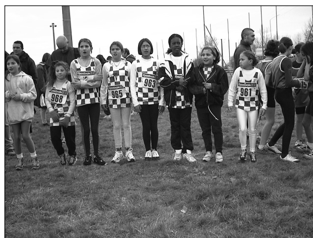
St André de Cubzac poussinades les poussines au départ