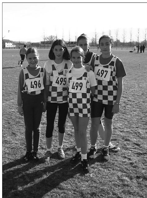
Oloron Aquitaine cross nos benjamines