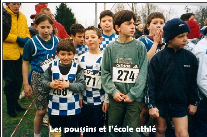
Les poussins et l'école athlé

Par une journée bien froide notre fidèle effectif des cross était au rendez vous pour cette dernière compétition des poussinades hivernales d'une série de trois. C'était aussi pour les moins jeunes ou les vétérans encore jeunes leur compétition: le Championnat d'Aquitaine des plus de 50 ans.