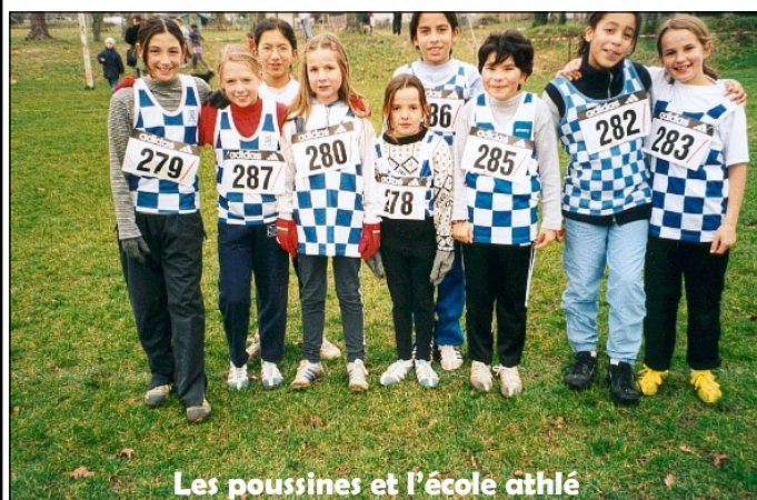
Les poussines et l'école athlé