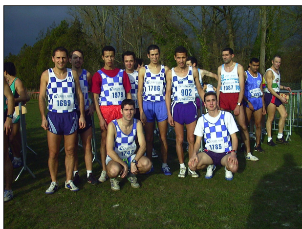
L'équipe masculine séniors