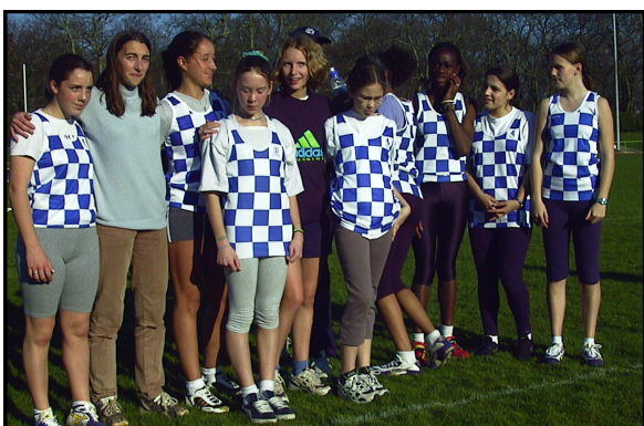
Une partie des benjamines et minimes