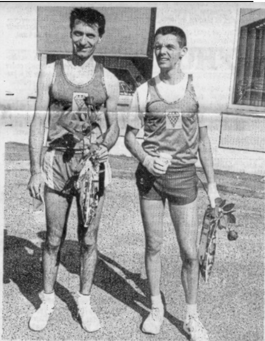
Les deux premiers Béglais

Le Masque Béglais organise, le dimanche 12 mai, une excursion repas à Saint-Etienne-de-Baigorry (Pyrénées-Atlantiques). Départ fixé à 8 heures. Vi-