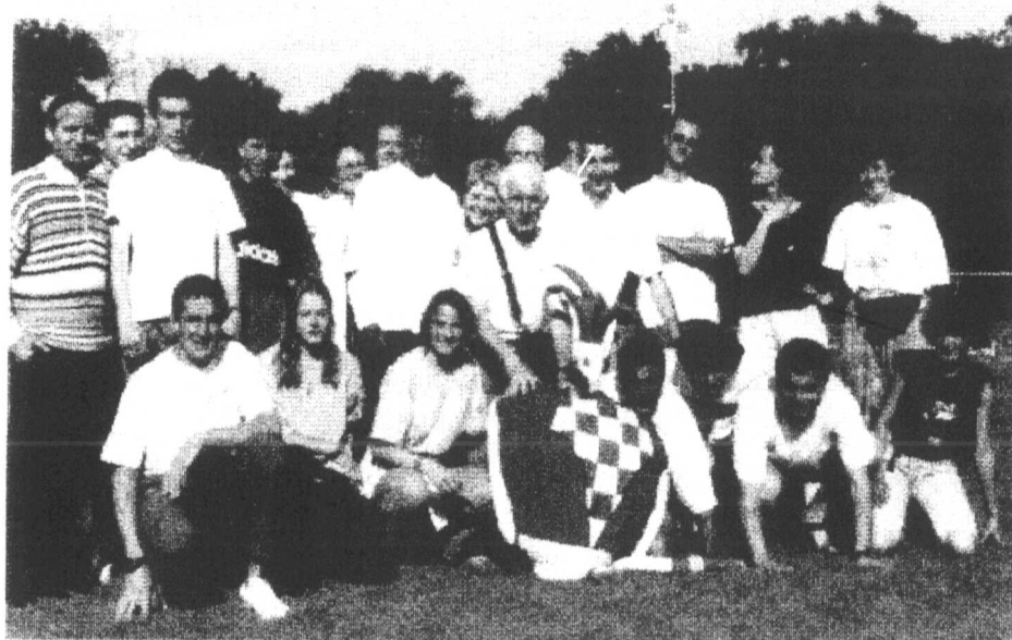
INTERCLUB 96