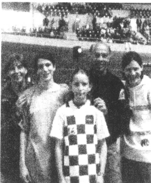
CHAMPIONNAT DE GIRONDE 1997