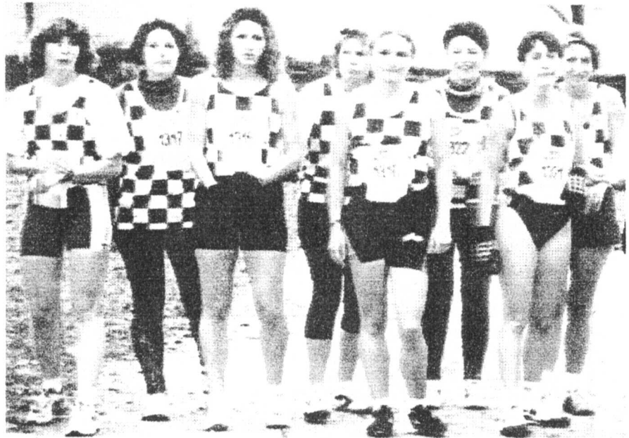
L'équipe Séniors féminine au cross de Bègles

La trêve des confiseurs se rapprochant, Infos Stade est heureux de vous présenter ses meilleurs voeux pour l'année 97.