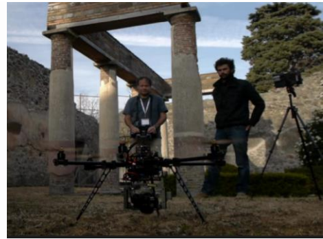
Projet Pompéi, DI ENS