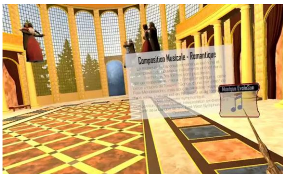
Visite en RV de l'histoire de la musique, Immersia, Irisa