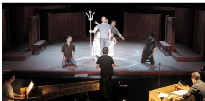
Spectacles en ligne (LJK, CERILAC, LIRIS)