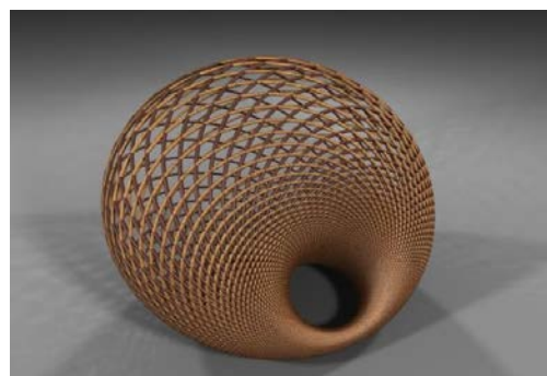
Cyclide de Dupin, CRISTAL