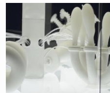
La mer est mon miroir, lab-Sticc, et RCO, LRI.