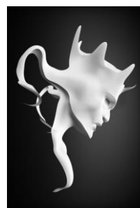
Sculpture virtuelle (LIRIS et LJK)